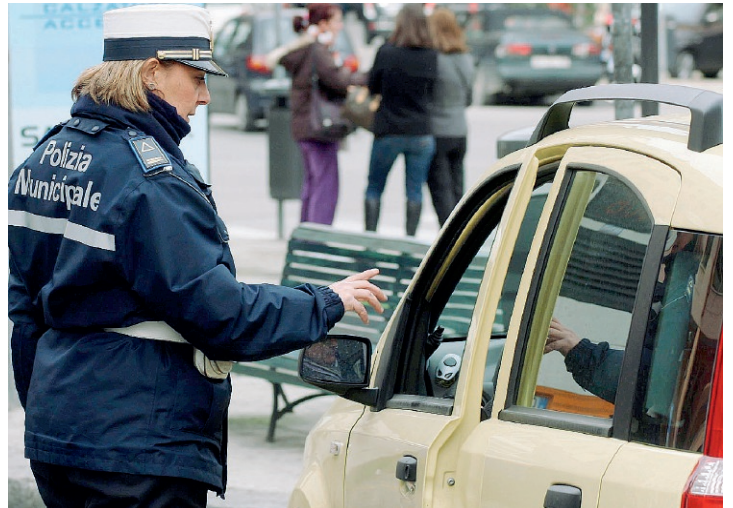
Un controllo dei vigili urbani